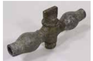
乙止水栓 (玉川水道株式会社・昭和初期)

水道に使われる給排水管や止水栓などのさまざまな器材を、2回に分けてご紹介します。(次回 6/22～7/7)