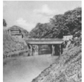
神田上水 お茶の水の掛樋 (明治時代)

江戸上水の中で確実に存在が確認される最も古い上水が「神田上水」です。井の頭池を水源に、江戸東北部の人々の暮らしを支えたその歴史を振り返ります。