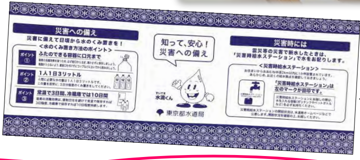
←オリジナル手ぬぐい

災害時給水ステーションマップや まとめリーフレット、防災グッズを プレゼント ！