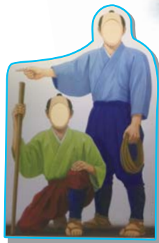
玉川兄弟の記念撮影用パネル