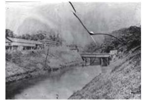
恐らく明治34年(1901)以前