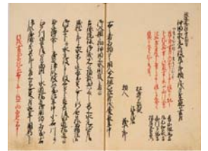
「内田茂十郎書付」(『上水記』・部分)

江戸最初の上水といわれる「小石川上水」と、溜池に発したといわれる「溜池上水」などを通して、江戸での上水の誕生について考えます。