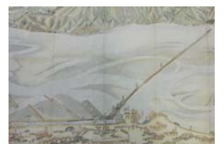
『玉川上水堰元水行之図 全』(部分)