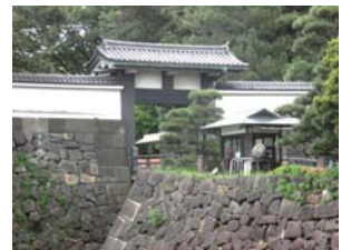
江戸城本丸北桔橋門

江戸の上水はどのような構造で水を送っていたのかを、2 回にわたり考えます。1 回目は、上流部分の上水堀 (白堀) と石樋について検討します。