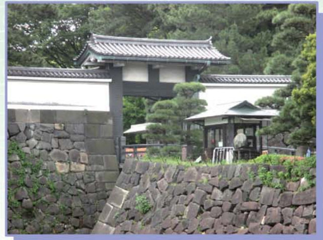
江戸城本丸北桔橋門