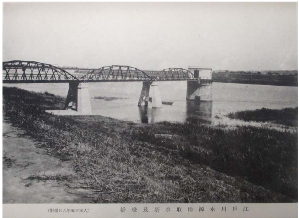
「江戸川水源地取水塔及棧橋」(『江戸川上水道概要』より)

大正15年(昭和元年・1926)に現在の墨田区、荒川区、江東区を中心とする3郡12町によって設立されたのが「江戸川上水町村組合」です。昭和7年(1932)この地域が東京市に編入され、東京市水道に統合されるまで、地域の水需要を支えました。現在の金町浄水場も、最初はこの江戸川上水町村組合の施設でした。当時の写真や関連書籍などの資料を紹介します。